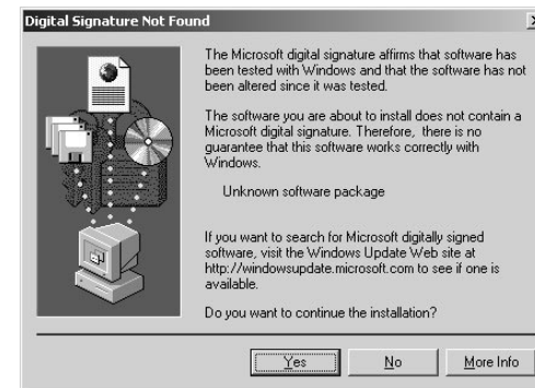
Obrázek 1-3: Digitální podpis nenalezen - dialogové okno.