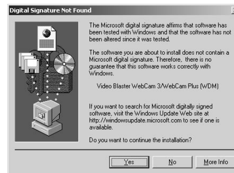
Obrázek 1-4: Digitální podpis nenalezen - dialogové okno.